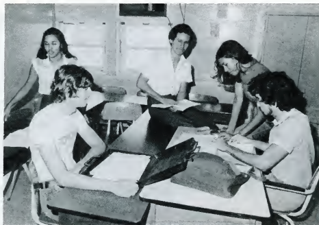
Muziekles op de A.P.A.

anderen en zichzelf beschouwd worden als de "opleiders". Lanier & Little spreken in dit verband van het verschil tussen de "donatieve" (-letterlijke) en "connotatieve" (-subjektieve, gevoelsmatige) betekenis van het begrip opleider. (p. 528-529). In Aruba is mijns inziens het identificatie-proces van de docenten met het opleidingsgebeuren sterk positief beïnvloed door de verschillende IKOL's (Interinsulair Kontakt Opleiding Leerkrachten) waarin opleidingsdocent van de APA en APK sinds 1981 bijna jaarlijks bijeen kwamen om belangrijke opleidingszaken te bespreken. Ook het congres "Toekomst Opleidingen" in 1982 op Curacao en het Symposium over de Scholing op Aruba in 1986 hebben hiertoe positief bijgedragen.